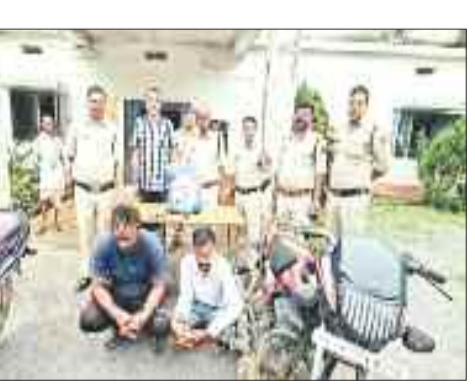
आया लेकिन बाइक सवार पुलिस को देखने के बाद भागने लगा। पुलिस ने बाइक सवार का पीछा कर पकड़ा तो युवक को

गांजा तस्करी के मामले में पुलिस ने कार्रवाई करते हुए तस्कर व सप्लायर को गिरफ्तार किया है। पुलिस ने आरोपियों के पास से 5 किलोग्राम से अधिक गांजा बरामद किया है। जानकारी के अनुसार 3 जुलाई को लुंडा पुलिस पेट्रोलिंग पर निकली थी। इस दौरान नागम बांसपारा पुलिया के समीप मंडरापाट कैलाश गुफा की ओर से बाइक सवार आता हुआ नजर