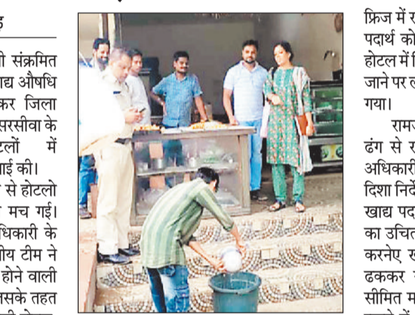
पाई गई। साथ ही पीने के पानी की व्यवस्था भी ठीक नहीं पाई गई। जिस पर अधिकारी द्वारा होटल के संचालक को फटकार लगाते हुए एक सप्ताह के भीतर व्यवस्था सुधारने के निर्देश दिए गए। साथ ही

वर्षा ऋतु में दूषित जल से होने वाली संक्रमित बीमारियों को देखते हुए बुधवार को खाद्य औषधि प्रशासन विभाग ने एक्शन में आकर जिला मुख्यालय से करीब 20 किलोमीटर दूर सरसीवा के विभिन्न होटलों में ताबड़तोड़ कार्रवाई की। कार्यवाही से होटलों में अफरा तफरी मच गई। खाद्य सुरक्षा अधिकारी ने नेतृत्व में विभागीय टीम ने बारिश के मौसम में खाद्य प्रतिष्ठानों में होने वाली गंदगी के लिए छापामार कार्रवाई की जिसके तहत टीम ने सरसीवा के अल्ली होटल, रामजी होटल, हितेश होटल, बालाजी होटल, मून नाइट होटल, पिच्चा हाउस एवं अन्य छोटे खाद्य प्रतिष्ठानों की जांच की, जिसमें अल्ली होटल में निरीक्षण करने पर किचन व स्टॉरिज रूम में बहुत अधिक गंदगी