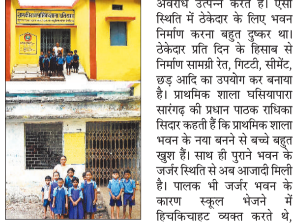
निर्माण कराना मुश्किल का काम था। मोहल्ले में कई नागरिक स्कूल के काम में सहयोग देते हैं तो कई

कटेली। मुख्यमंत्री जतन योजना अंतर्गत वित्तीय वर्ष 2022-23 में 12 लाख 80 हजार स्वीकृत की गई। जिला मुख्यालय और नगरपालिका परिषद सारंगढ़ के चसियापारा में प्राथमिक शाला के नए भवन का लगभग 10 वर्ष बाद निर्माण हुआ है। प्राथमिक शाला भवन जर्जर होने के कारण अतिरिक्त कक्ष में प्राथमिक शाला का संचालन किया गया। अतिरिक्त कक्ष का भी भवन जर्जर होने पर वर्ष 2018 में सामुदायिक भवन में प्राथमिक शाला का संचालन किया गया। निर्माण एजेंसी ग्रामीण यांत्रिकी सेवा विभाग के लिए मोहल्ले के भीतर प्राथमिक शाला भवन का