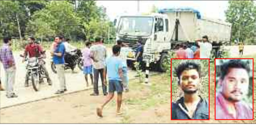
घटना स्थल पर लोगों की भीड़, इनसेट में मृतक।