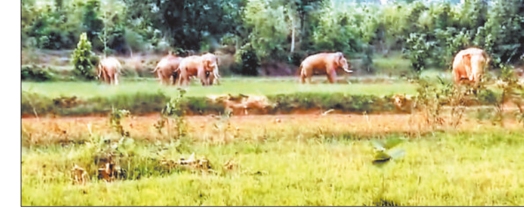
खेतों में लगे फसल को रौंदते हाथी।

पिछले एक महीने से नारायणपुर क्षेत्र के आसपास के ग्रामीणों की रात की नींद और दिन का चैन छीन गया है। शाम के वक्त ग्रामीणों के खेतों में जंगली हाथियों डर से आस पास के ग्रामीण रतजगा करने को हुए मजबूर ग्रामीणों की दिल की धड़कन बढ़ने लगती है। कौन जाने किधर से हाथियों का झुंड गांव में आ जाए। ग्रामीणों का कहना है, कि मंगलवार को हाथियों का समूह चराईमारा के जंगलों से निकलकर रानीकोबा गांव के पास खेतों में रात 9 बजे के आसपास घूमते हुए देखे गए। मुस्किल तो थे। वेसे ही गीधबहार के जंगलों में ग्रामीणों ने 4 हाथियों के दल को देखने की बात कही है। इस तरह नारायणपुर वन सर्किल में दर्जनों हाथियों का आतंक बना हुआ है।