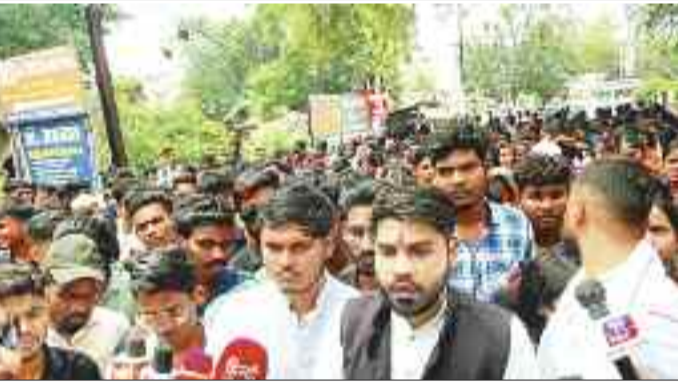
विश्वविद्यालय के सामने प्रदर्शन करते छात्र।

परीक्षा के परिणाम से असंतुष्ट सैकड़ों छात्रों ने आजाद सेवा संघ के बैनर तले आज रैली निकाल कर विश्वविद्यालय का घेराव कर प्रदर्शन किया। परीक्षा परिणाम में जीरो अंक पाने से छात्रों में काफी आक्रोश नजर आया। साथ ही विश्वविद्यालय प्रबंधन से उत्तर पुस्तिका की पुनःमूल्यांकन करने के साथ रिचेकिंग की तिथि को आगे बढ़ाने की मांग की।