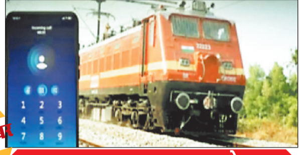
तत्काल समाधान करना उद्देश्य

रेलवे अब ऐप के जरिए यात्रियों की सफर के दौरान मदद कर रहा है। ये ऐप यात्रा के दौरान चौबीस घंटे सातों दिन खुला है। रेलवे ने इसका नाम भी रेल मदद ऐप रखा है। इसके जरिए यात्री सफर में संबंधित ट्रेन के कोच में साफ सफाई, रिजर्वेशन सीट को लेकर परेशानी, बच्चे का दूध, बुजुर्ग यात्री की दवा और सफर में आकस्मिक मदद समेत अन्य सहायता उपलब्ध कराई जा रही है। बिलासपुर रेल मंडल अंतर्गत रेल मदद ऐप पर हर माह करीब 3 हजार शिकायतें प्राप्त हो रही हैं और उनका महज कुछ मिनटों में शत प्रतिशत निराकरण भी हो रहा है। रेल मण्डल से मिली जानकारी के मुताबिक रेल मदद ऐप के माध्यम से मिलने वाली