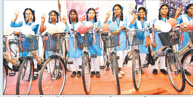
मुख्यमंत्री द्वारा आवंटित साइकिलें प्राप्त करने के बाद खुशी का इजहार करती छात्राएं।