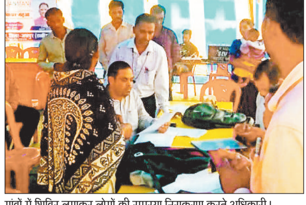
गांवों में शिविर लगाकर लोगों की समस्या निराकरण करते अधिकारी।